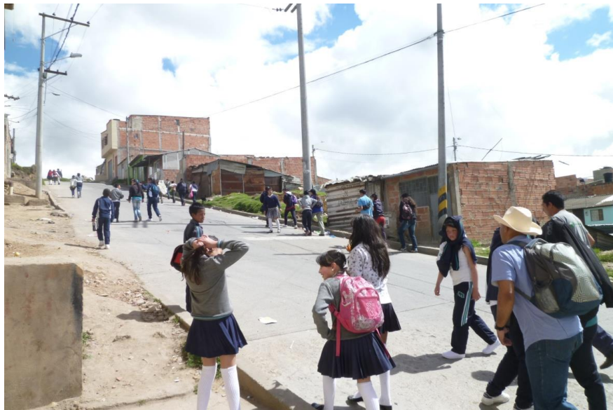
Recorrido a Quiba. MT Naciones Unidas

Recorridos inter-escolar desde un colegio a otro y a otro, hasta llegar al colegio anfitrión, donde se realizarán las actividades de ese día, y al siguiente encuentro nuevos recorridos para conocer los demás colegios.