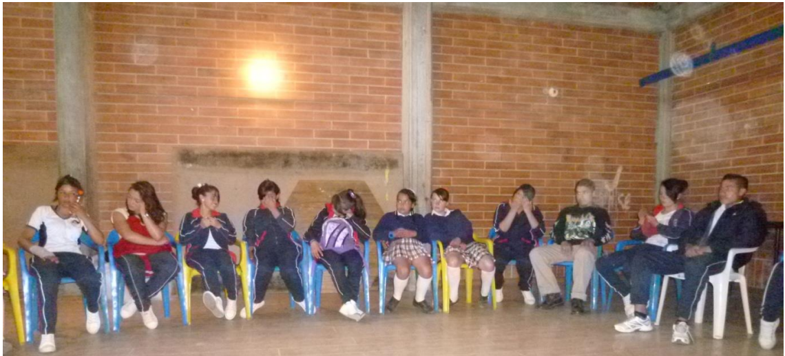
Encuentro de solidaridad. , IED La Arabia. Casa Cultural La Arabia