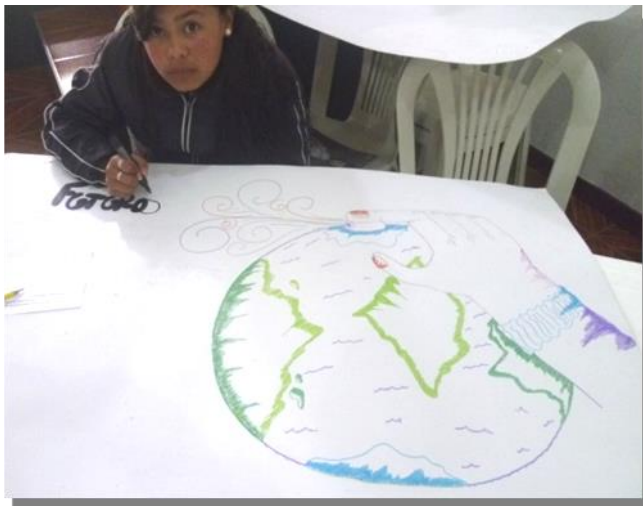
Diseño y Creación del Logo Red Futuros Investigadores