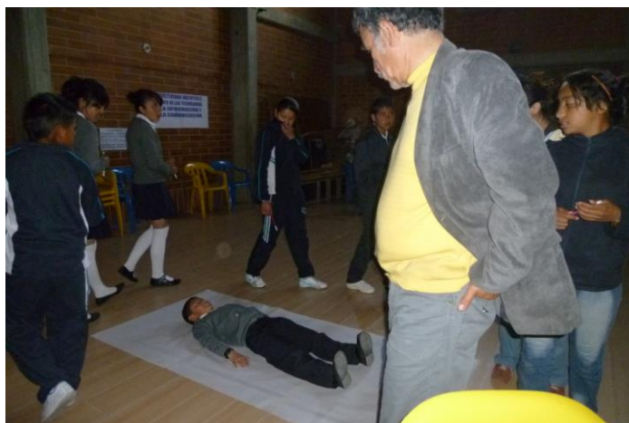
Concepto de cartografía y territorio – Casa Cultural Arabia

Aquí se hace una pequeña pero importante variación de asociación, trazando el croquis del cuerpo y desde allí empezar a construir el concepto con los NNJ, este aporte facilita en ellos recorrer, observar e investigar, a la vez que se van apropiando de los territorios que habitan.