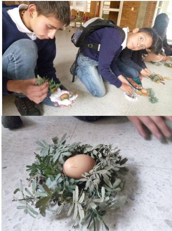
Taller de Auto cuidado - MT Naciones Unidas