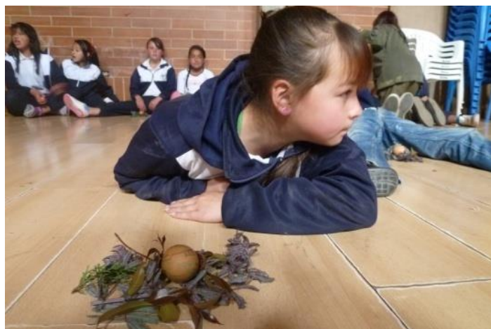
Taller de Cuidado y percepción de los sentidos