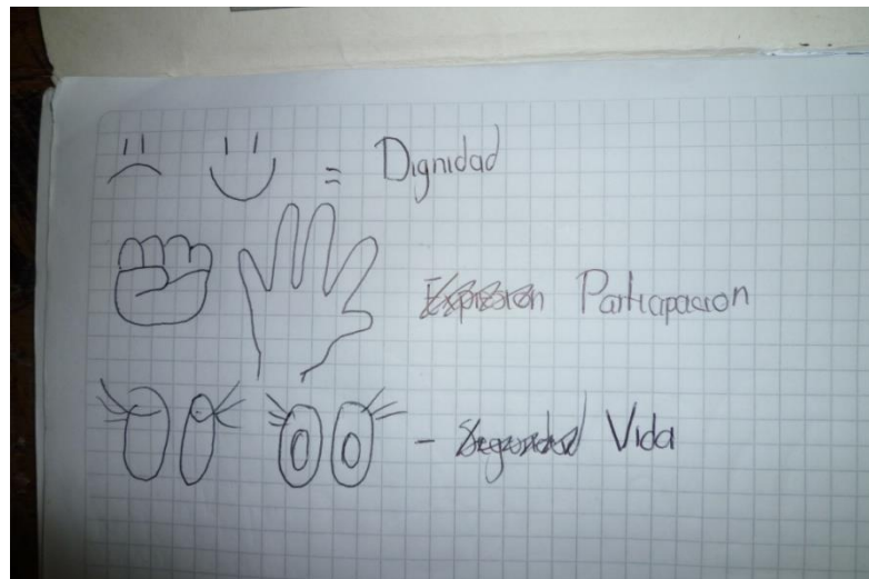
Taller de territorios de Vida, Dignidad y Participación – MT Naciones Unidas

Juan Pablo II: reconocer los derechos con la Capsula de la Memoria – cartografía de mis emociones – comprensiones y territorios VDP– piscina – mariposario - Biodanza -