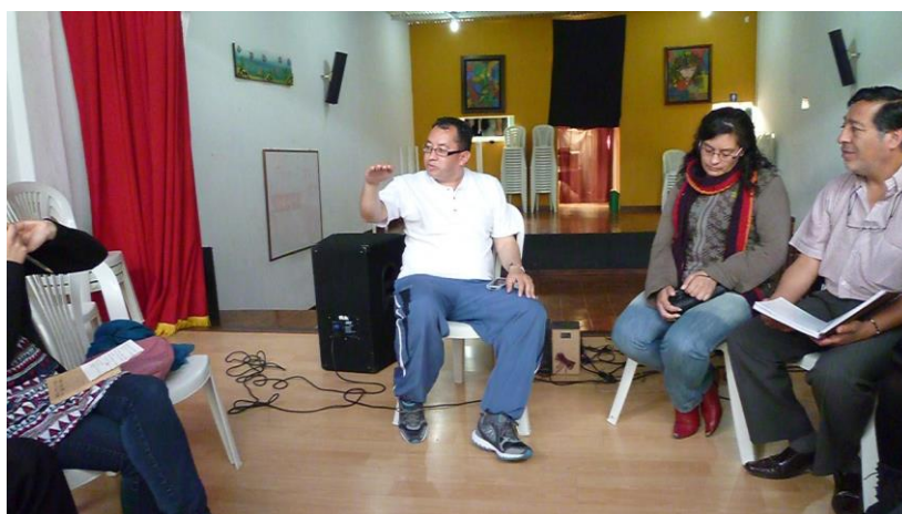
Reunión Local Organizaciones de Base- Escuela CB Bien-(Juan Pablo II=

Entre representantes de Organizaciones de Base, colegios y NNJ, para construir acciones metodológicas, revisar y evaluar las herramientas pedagógicas y el proceso de avance de la red y las acciones. Estos círculos de cultura se realizan por micro-territorios (Juan Pablo II), (Naciones Unidas), (Mochuelo Rural) y en algunas ocasiones participan representantes de los 3 micro-territorios de la localidad en un mismo encuentro. Estos círculos de cultura se realizan en diferentes lugares, promoviendo que todos los actores visiten y conozcan todo los lugares, instalaciones y entornos.