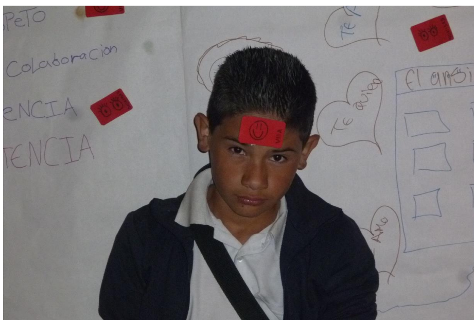
Taller vivencial de apropiación de territorios a través de Biodanza. IE El Tesoro La Cumbre Sede Bicentenario

En los círculos de cultura se hacen relatos vivenciales de las experiencias pedagógicas o de saberes y están dispuestos para que NNJ y la comunidad puedan libremente conversar sobre los problemas, se busquen soluciones y se crean acciones conjuntas; a su vez, se generan espacios que cultiven la creatividad como función natural existencial humana.