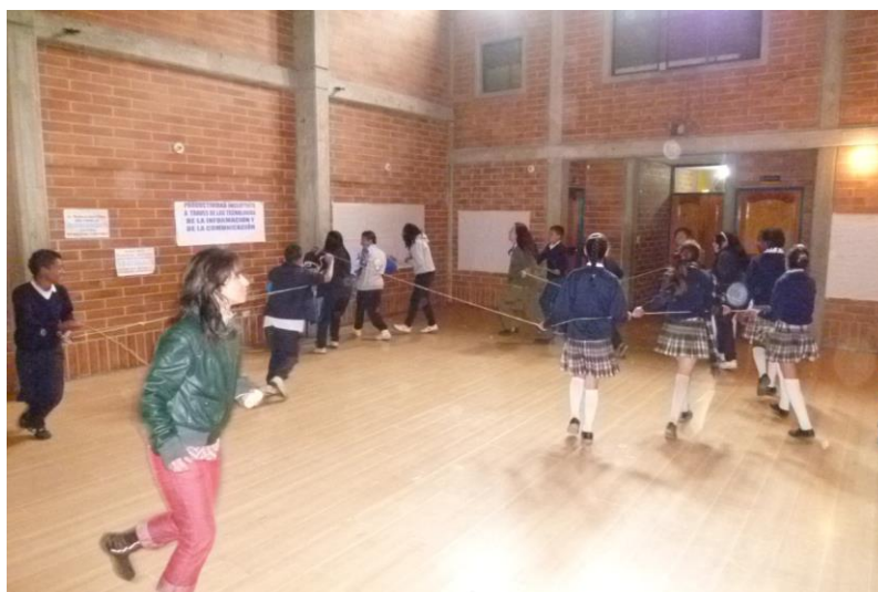
Creando la ruta en el territorio- Reconocer los pasos de nuestros ancestros en las montañas que hoy habitamos. taller de Biodanza

Al comienzo de algunos de los encuentros, los NNJ expresan el afecto hacia otros con golpes y malas palabras, les cuesta mucho trabajo hacer rondas tomados de la mano, trabajar en parejas, prefieren hacerlo en equipo, hablan mucho entre sus grupos pero les cuesta mucho expresar al grupo general algún punto de vista o incluso presentarse, mantienen sus grupos cerrados y tienen una postura corporal “tímida”, pero al finalizar el taller, muchos de estos aspectos ha cambiado paulatinamente, sin embargo el proceso toma bastante tiempo.