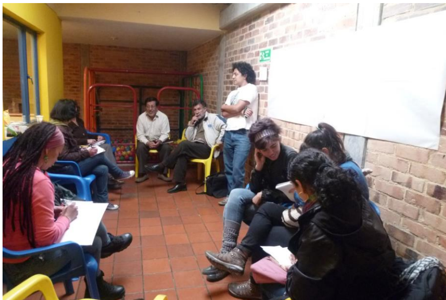
Encuentro de Organizaciones de Base Comunitaria de diferentes UPZ de la Localidad Ciudad Bolívar

A estas redes más tarde se unieron Organizaciones e Instituciones educativas de otras UPZ Rurales como el Mochuelo de la misma localidad Ciudad Bolívar, como resultado de los círculos de cultura de todas las redes que se realizaron cada dos meses en diferentes lugares recorriendo diferentes barrios.