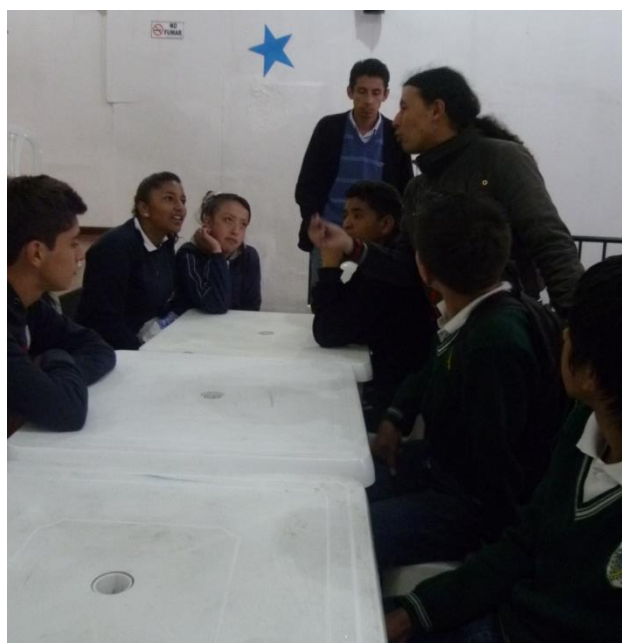
Taller de Esténcil, Escuela CB Bien. Juan Pablo II

La implementación de estas acciones en diferentes momentos de los talleres y encuentro promueve en los NNJ que se entreguen más a las instrucciones y actividades solicitadas, proporciona estados de clama y concentración, adicionalmente permite que a partir del juego se induzcan conceptos sobre los cuales se trabaja en el taller. Los NNJ expresan que aprendizajes a partir del juego, a la vez que se fortalece el espacio de encuentro como un espacio de Goce efectivo de derechos, seguridad y confianza. La posibilidad de soltar y relajarse, les permite también darle el espacio a la creatividad, y facilita la expresión autentica de sus emociones e ideas.