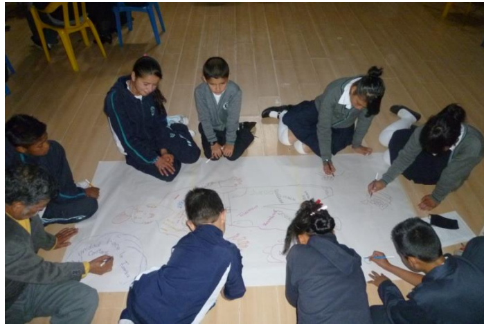
Taller de conceptos de cartografía- territorio y cuidado – MT Naciones Unidas